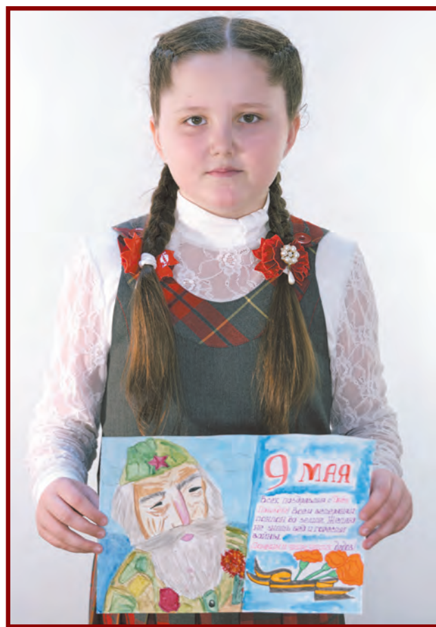
Рисунок Насти Бердниковой 2 В класс